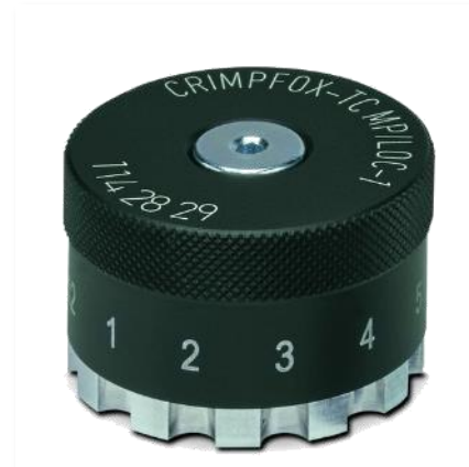
LOCATOR Для SACC and CK contact's