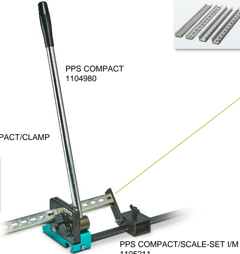
PPS COMPACT/SCALE-SET I/M 1105211

NS 35/7.5 : AL, CU, ST, V2A NS 35/15 : AL, CU, ST