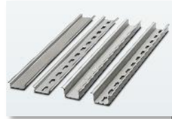
PPS COMPACT 1104980