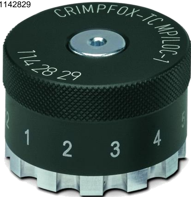
CRIMPFOX TC MP/LOC-1 1142829