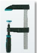
PPS COMPACT/CLAMP 1105215