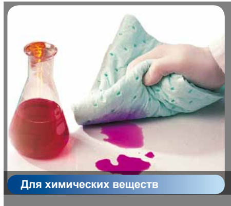
Для химических веществ