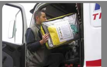
Комплект ADR для сбора проливов