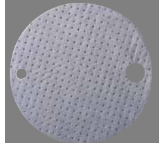
Прокладки под крышки бочек