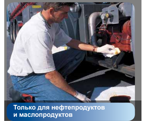
Только для нефтепродуктов и маслопродуктов