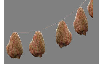
Сетки для нефтепродуктов